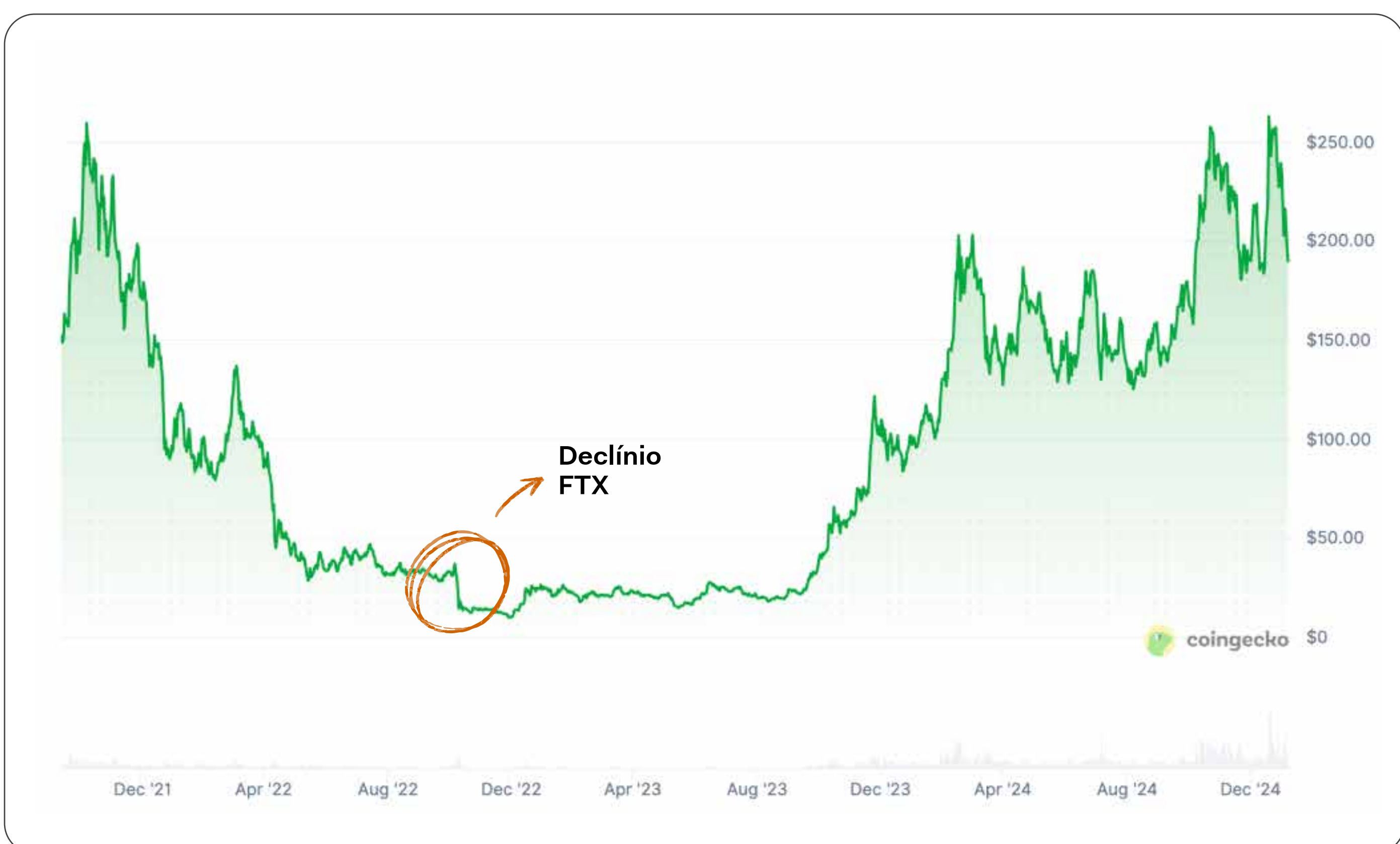
Evolução do preço da Solana de 2021 - 2025

Muitos decretaram a sua morte. Mas os fundamentos técnicos da rede eram sólidos. A Solana deu a volta por cima e, três anos depois, atingiu um recorde histórico de US$ 293 .